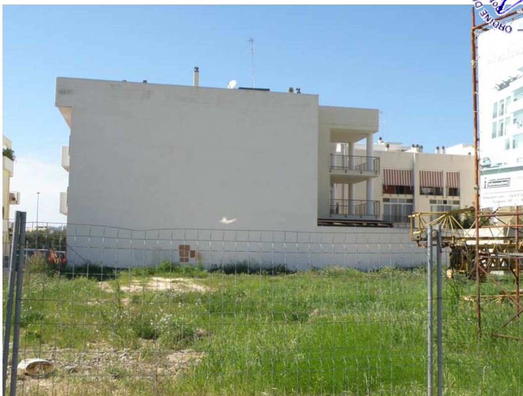
1 - 2 – In alto ed in basso: vista da via Del Pero ang. Via Del Pesco l'area oggetto del Permesso